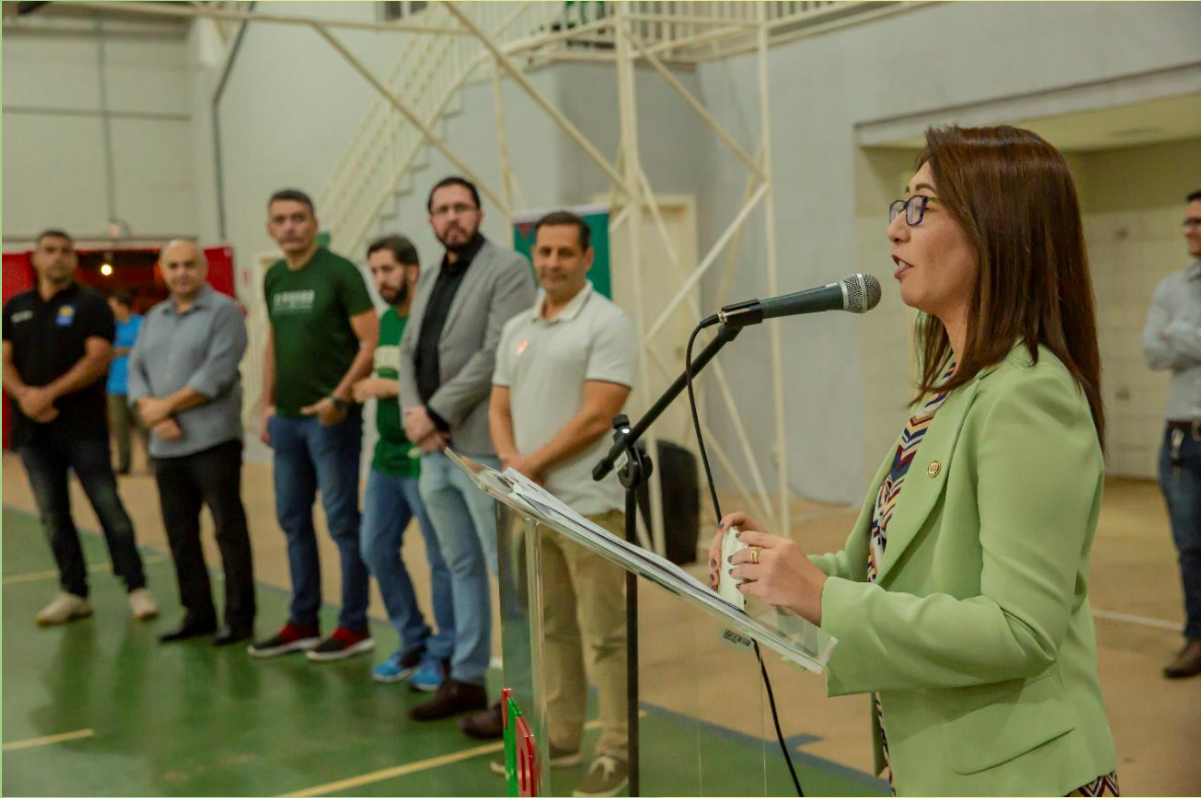
Luciana Massukado reitora do IFB, discursa na inauguração do Núcleo Social do Cerrado.